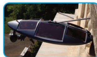
Exemple de capteur